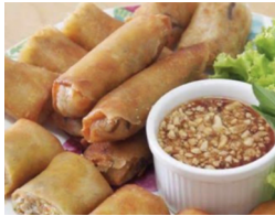
Frühlingsrollen 3 Stk. CHF 6.00