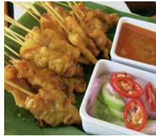
Poulet Spiessli 3 Stk. CHF 6.00