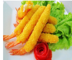
Crevetten paniert 5 Stk. CHF 6.00